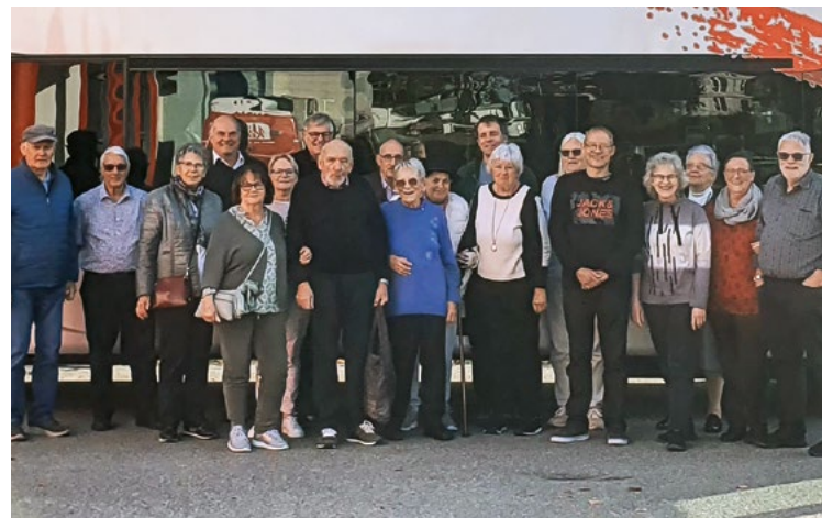
Die muntere Ausflugsgruppe.

Die moderne Architektur des neuen Klanghauses in Wildhaus und die spannenden Einblicke beeindruckten alle Teilnehmenden. Die Umgebung war ein weiteres Highlight: Mit Blick auf den Säntis und die Churfürsten präsentierte sich das Toggenburg von seiner schönsten Seite. Viele nutzten die Gelegenheit für schöne Aufnahmen, die sich bestens als Sujets für Postkar-