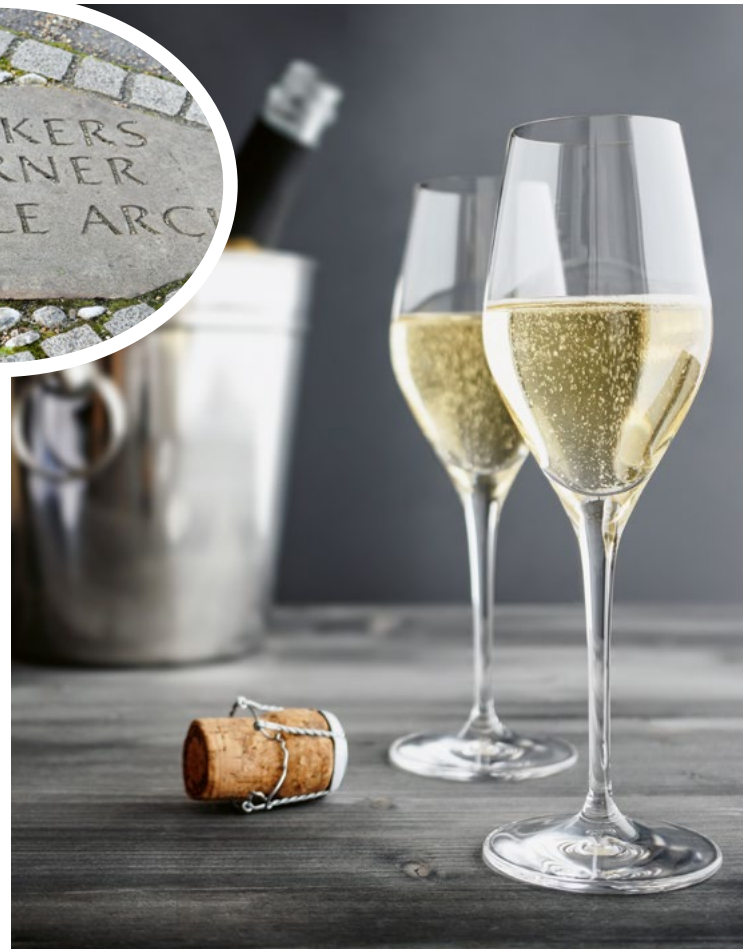
À la santé des jours heureux.