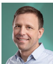
Longin Korner Qualité