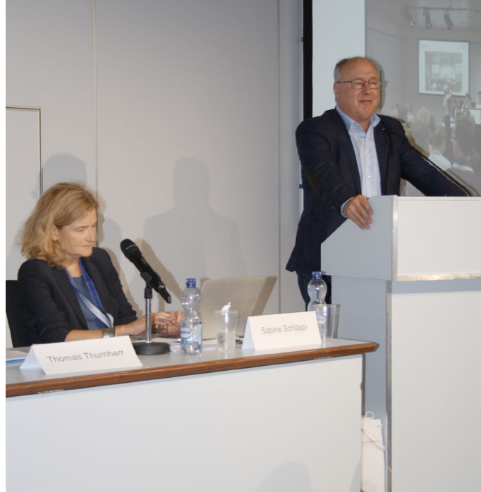
Discours de bienvenue du CN Pierre-Yves Maillard à l'ouverture de l'AG à Lausanne, septembre 2021.

L'allocution de bienvenue du conseiller national et président de l'Union syndicale suisse Pierre-Yves Maillard, en ouverture de l'assemblée générale, a mis en évidence l'importance du travail politique, aux niveaux tant cantonal que national. Le conseiller national Pierre-Yves Maillard a pu, en tant que président de la Conférence suisse des directrices et directeurs cantonaux de la santé (CDS), largement contribuer à la création de l'offre de formation qui existe à Zurich depuis 2008.