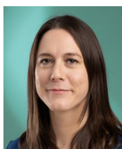
Karin Mantel Communication interne