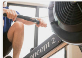
Sport, Fitness und Pilates

Équipements et installations thérapeutiques